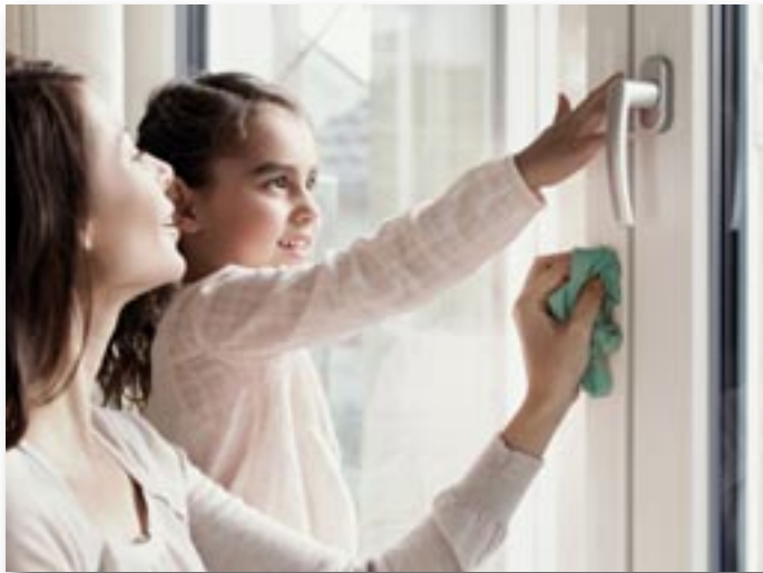
Kunststofffenster punkten durch ihre Pflegeleichtigkeit.