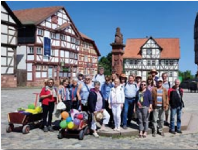
Da Capo beim Chorausflug 2023 zum Hessenpark.

Bei ihrem diesjährigen Sommerausflug trafen sich die Sängerinnen und Sänger des Hainhäuser Chors »Da Capo« nebst Partnern zu einem informativen und geselligen Besuch des Freilichtmuseums Hessenpark bei Neu-Anspach.