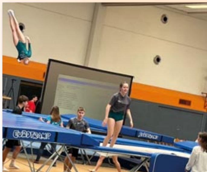
Trampolin im Wettkampf

In allen Altersklassen für Jungen und Mädchen bis zum Leistungszentrum des HTV. Trampolinturnen macht nicht nur Spaß, sondern es ist